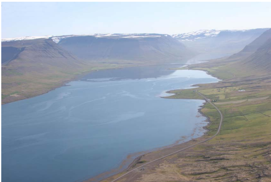
Mynd 1. Horft inn Dýrafjörð í ágúst 2006 (Ljósmynd NAVE/Böðvar Þórisson).

Í þessari skýrslu eru birtar niðurstöður rannsókna á botndýrum í Dýrafirði.